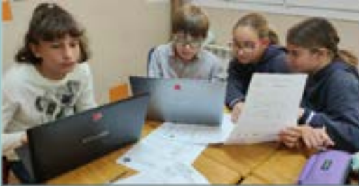
Ecosystem project – 5è

3. Investigació: Recollim informació i ens documentem amb experts, Internet, llibres, etc.