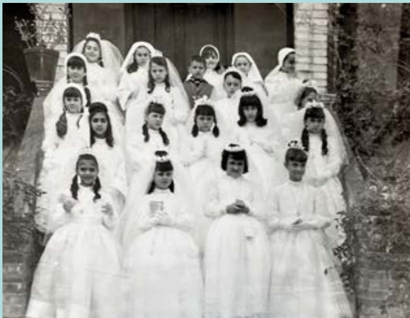
Foto de grup d'alumnes fent la primera comunió al centre.