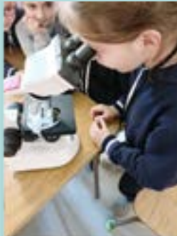
Projecte alerta virus! Ens envaeixen– 3r

5. Conclusions: Analitzem tota la informació obtinguda, verifiquem o refutem la nostra hipòtesi i donem resposta a la pregunta o preguntes inicials