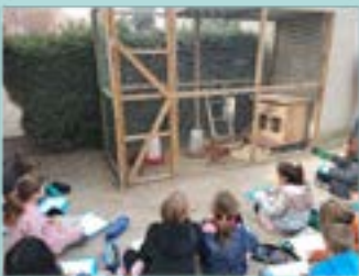
Projecte de les gallines – 2n

1. Observació: Identifiquem un problema o situació i ens fem preguntes.