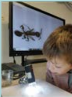
Projecte de les formigues – 1r

4. Experimentació: fem experiments que ens permetin demostrar o refutar la hipòtesi inicial i que ens ajudin a recollir més informació per entendre els successos.