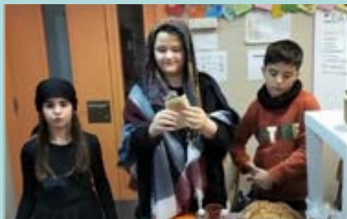
Fira Medieval – 5è

5. Conclusions: Analitzem tota la informació obtinguda, verifiquem o refutem la nostra hipòtesi i donem resposta a la pregunta o preguntes inicials